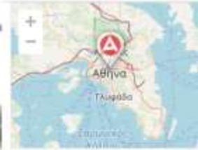
Άποψη της θέσης του Ιερού της Αρτέμιδος Αγροτέρας στα Μεταξάδες.